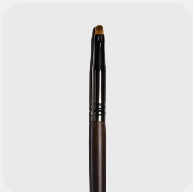
КИСТЬ ДЛЯ ПОДВОДКИ