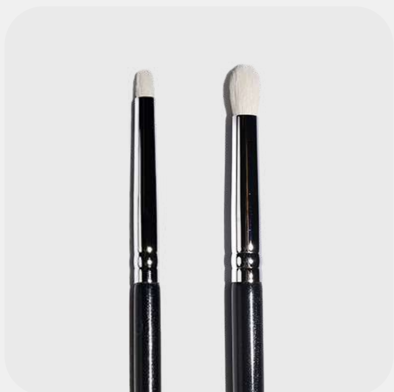
КИСТЬ-БОЧОНОК маленькая и большая