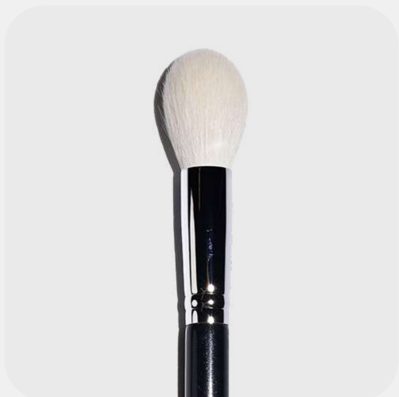
КИСТЬ ДЛЯ ПУДРЫ