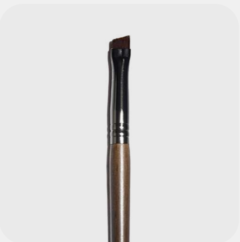
КИСТЬ ДЛЯ БРОВЕЙ скошенная