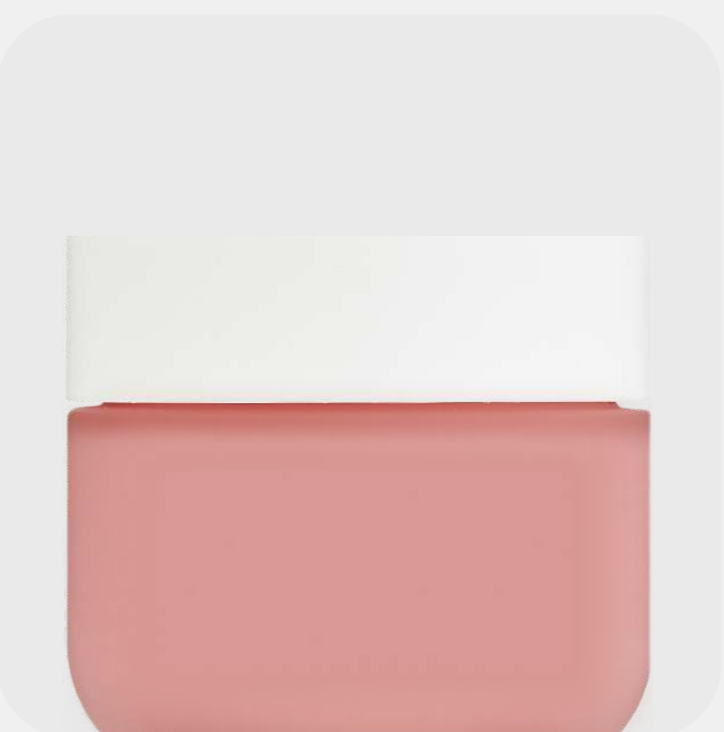
КРЕМ ДЛЯ ЛИЦА увлажняющий