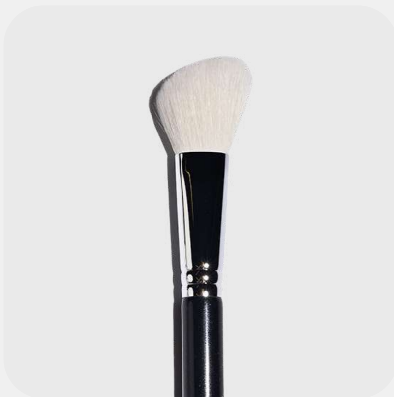
КИСТЬ ДЛЯ РУМЯН и корректора