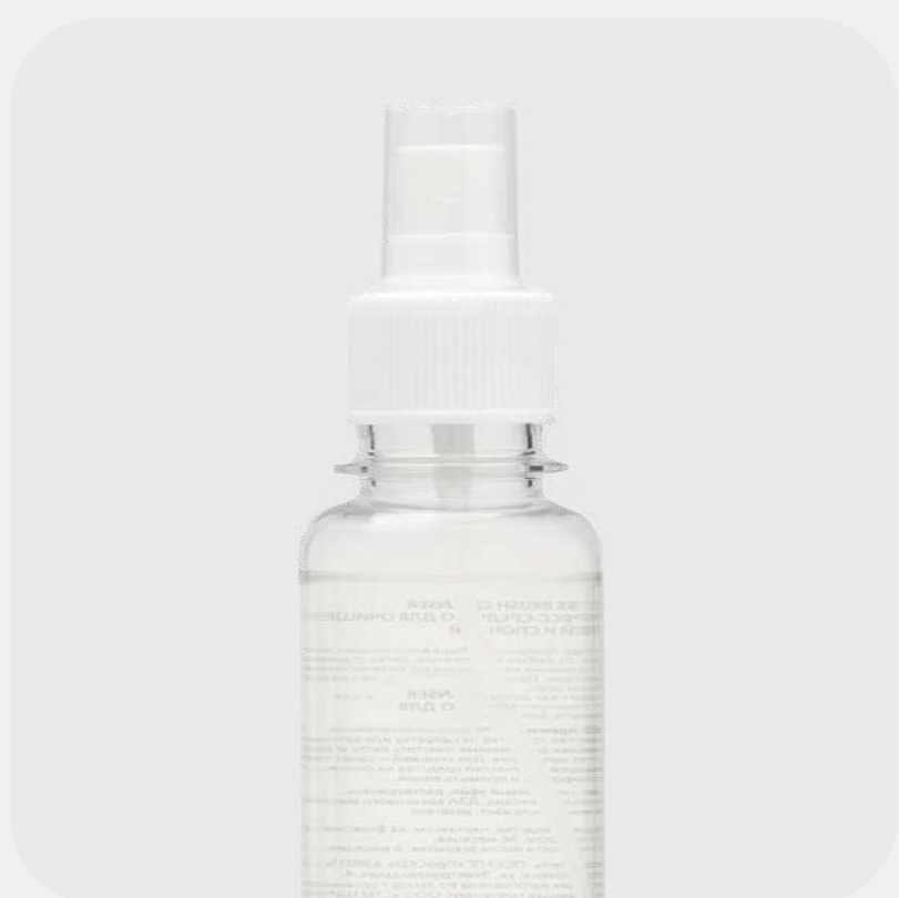
СРЕДСТВО для дезинфекции и очищения кистей