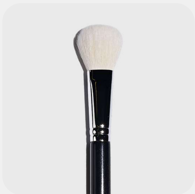
КИСТЬ ДЛЯ ТОНА пушистая