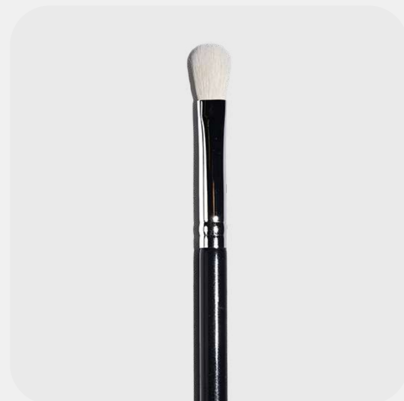
КИСТЬ ДЛЯ ТЕНЕЙ пушистая