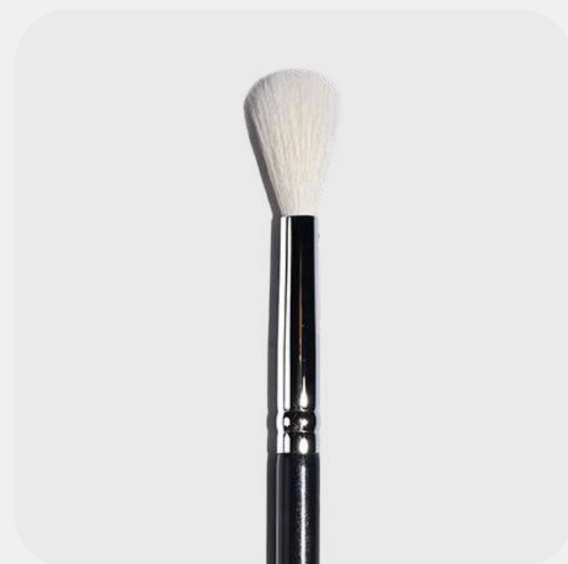
КИСТЬ ДЛЯ ХАЙЛАЙТЕРА