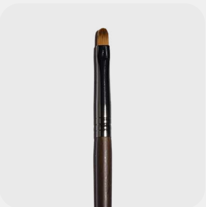
КИСТЬ ДЛЯ ГУБ