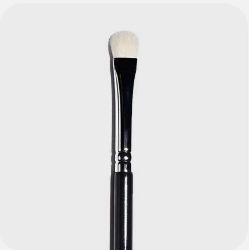
КИСТЬ ДЛЯ ТЕНЕЙ плоская